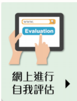
資歷架構「過往資歷認可」 美容業申請人自我能力評估表